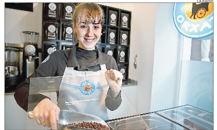
En el local se elaborarán, de forma natural y delante del consumidor